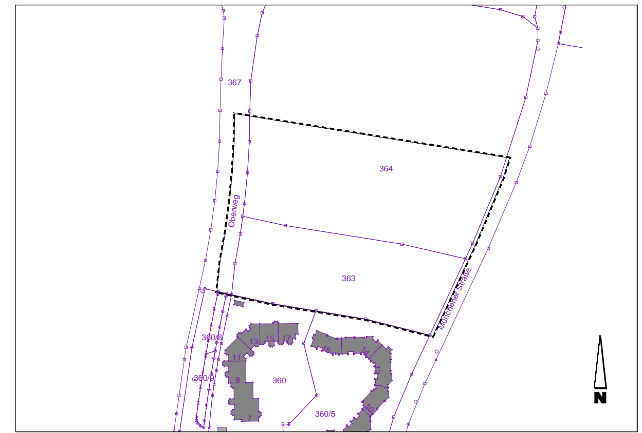
Übersichtslageplan M 1: 2.500